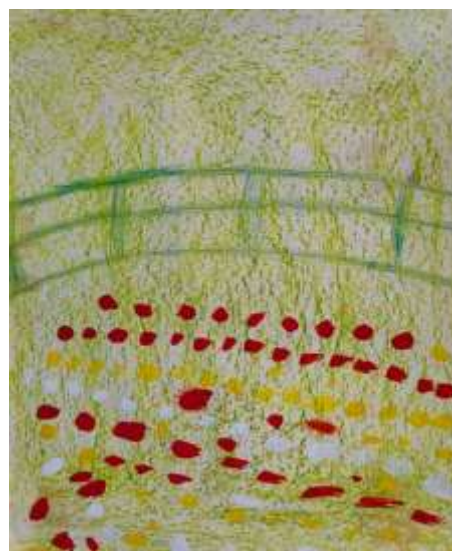
Bassin (inspiration Claude Monet)