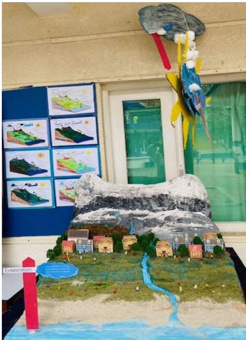
Maquette du cycle de l'eau