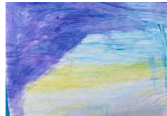
Aquarelle (inspiration William Turner)