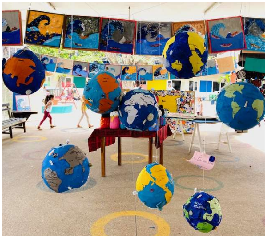
La terre dans 30 ans (Pollution)